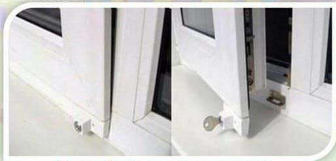
Замок блокировщик с ключом

Можно воспользоваться специальными замками блокираторами, которые предлагают установщики пластиковых окон.